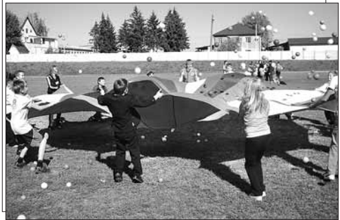
Акція „Подаруй дитині надію”