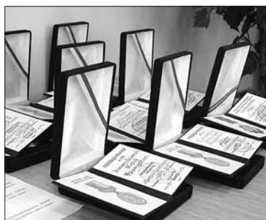
На фото: нагороди вченим НАПН, серед яких ювілейна медаль „НАПН – 20 років”, яку вручено кожному академіку-засновнику Академії