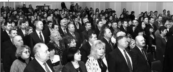
Відкриття конференції у ПНПУ імені В.Г.Короленка

пеклих ідеологічних, педагогічних і етичних колізій, місце постійного зіткнення максималістів – прибічників теорії і практики, традицій і інновацій, романтиків-ідеалістів і прагматиків. Адже і не дивно, досвід А. С. Макаренка надзвичайно складний передусім методологічно. Саме в особливостях методології вирішення виховних завдань ми маємо шукати підстави для розуміння унікальності його постаті серед плеяди провідних просвітителів людства. І у той же час не до кінця пізнана методологія Макаренка зумовила розмаїття шляхів сучасного освоєння його спадщини.