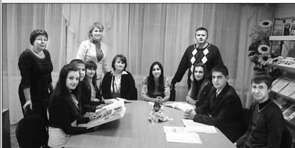
Круглий стіл зі слухачами та випускниками МАН України

Що історія ховає В мороці минулих літ, Мова рідна право має Жити, наче моноліт.