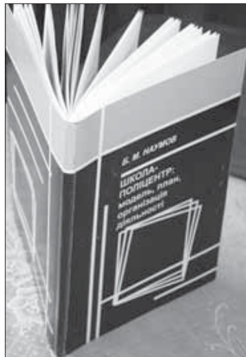
Наумов Б.М. Школа-поліцентр: модель, план, організація діяльності. – Х. : Кросроуд, 2010. – 119 с.

Посібник є практичним дорожовказом організації школи на нових засадах, тож не залишить байдужим жодного творчого читача.