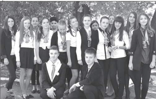
Мої учні у дрес-коді ліцеїста

Учнівський проект учнів 22 групи (10 класу) Кам'янець-Подільського ліцею – практико-орієнтований шлях