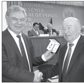
Найпріємніші миті: В.Г. Кремень вручає нагороди за наукові досягнення та особисто вітає достойників