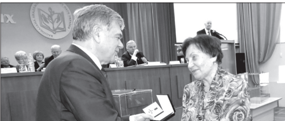
Учасники Зборів НАПН України